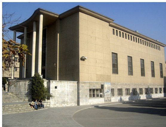
دانشکده هنرهای زیبای دانشگاه تهران