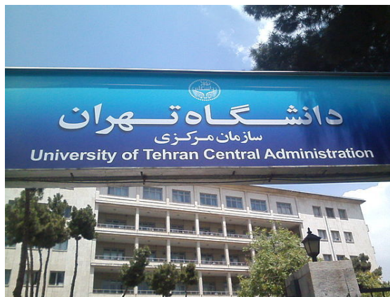
سازمان مرکزی دانشگاه تهران

جهان قرار داشت (که در تمام خاورمیانه پس از چهار دانشگاه اسرائیلی در رتبه پنجم قرار داشت). [18]