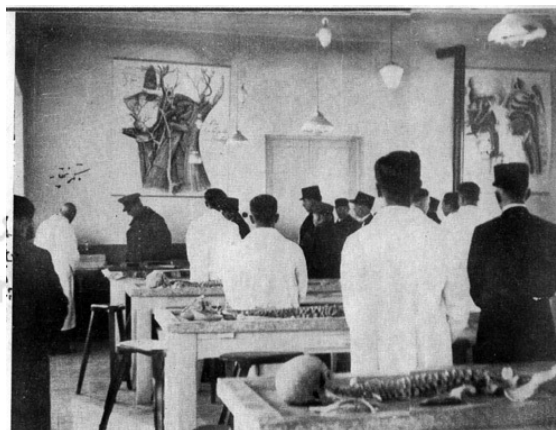
مراسم گشایش مدرسه طب دانشگاه تهران در حضور رضا شاه