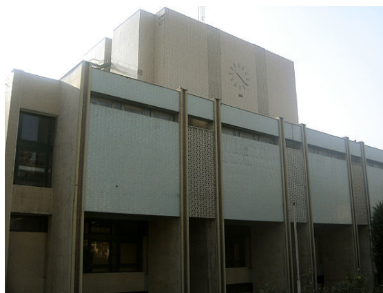
ساختمان کتابخانه مرکزی دانشگاه تهران